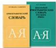
Орфографический словарь (+ толковый на изложение)