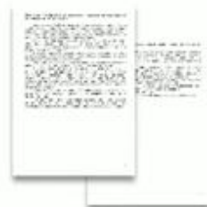
Инструкция для участника ИС или ИИ