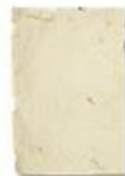
Бумага для черновики