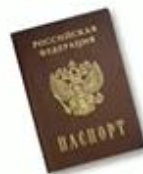
Документ, удостоверяющий личность